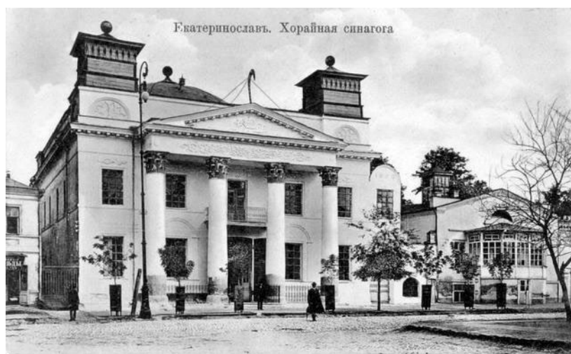
Рисунок 1 - Хоральна синагога. Фото початку ХХ століття

Будівництво синагоги було виконано з каменю, однак конструкція купола була вирішена з використанням дерев'яних елементів. Фасад будівлі витримано у класицистичному стилі, з двома симетричними вежами по обидва боки, оздобленими мотивами східної орнаментики, що надавало споруді виразного сакрального характеру. Центральним композиційним елементом інтер'єру була висока молитовна зала округлої конфігурації, яка справляла сильне просторове й емоційне враження.