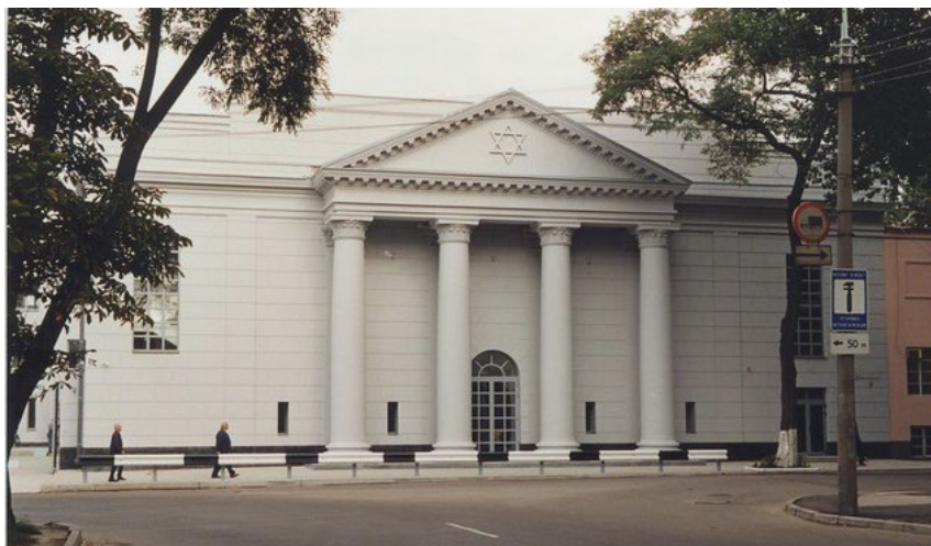
Рисунок 3 - «Золота Роза», фото 2008 року

спрямовують погляд до центрального композиційного акценту — ковчега зі свитками Тори, виконуючи також символічну функцію. Над входом із вестибюля до основної зали розміщено декоративний елемент у вигляді гілки золотої троянди, створений скульптором Ф. Майзлером [2].