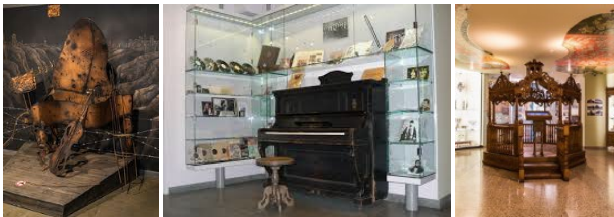
Рисунок.6 - Інсталяції Музею «Пам'ять Єврейського Народу та Голокост в Україні»

Просторова інтеграція музею в архітектурну структуру комплексу «Менора» створила передумови для синергії експозиційної, науково-дослідницької та освітньої діяльності. Це перетворило весь центр на активний осередок історичної рефлексії, комеморації та міжкультурного діалогу [4;7].