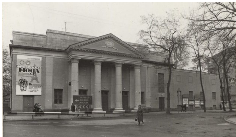
Рисунок 2 - Адаптація синагоги в якості швейного клубу за часів СРСР

Унаслідок цих трансформацій синагога втратила майже всю свою архітектурну автентичність: було демонтовано купол і бокові вежі, зруйновано первісну внутрішню структуру, а простір інтер'єру переформатовано відповідно до утилітарних функцій (рис. 2). В наслідок втрати сакральної функції синагога перестала виконувати також роль архітектурної доміанти в міському середовищі.