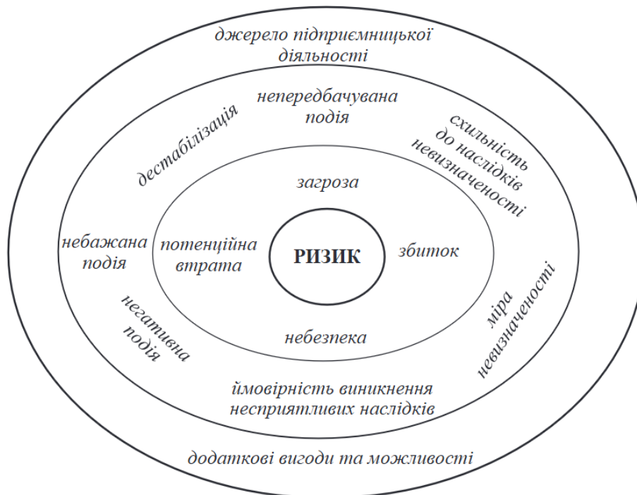
Рис. 2 - Градація ознак асоціативно-семантичного поля категорію «ризик»