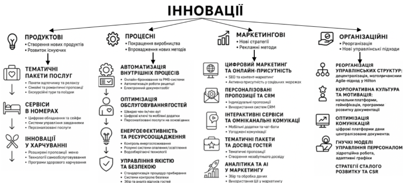
Рисунок 2 – Види інновацій у готельному бізнесі

Проведений аналіз дав змогу уявити інновації у готельному бізнесі у вигляді схеми (рис. 2) та зробити відповідні висновки.