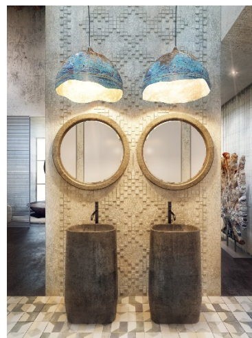
Рис.1. Ресторан «MED» (автор-Sergey Makhno Architects), м.Київ, Україна [1].

Декоративним елементом, що відтворений на окремих стінах закладу, виступає традиційний український орнамент. У підсумку, авторський колектив створив вишуканий інтер'єр ресторану «MED», з недосконалими формами, приглушеними кольорами, відкритими текстурами та із традиційними етно-мотивами, які милують око відвідувачів закладу, випромінюючи спокій та формують свою власну історію [1].