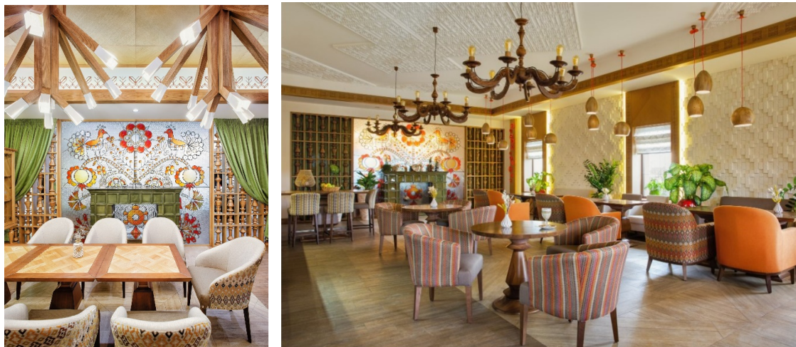
Рис. 4. Ресторан «Родичі» м. Жашків (автори-студія Loft Buro), Україна [4].

розписаний народним символом та оберегом – деревом життя. Кожен елемент декору доповнює та підкреслює атмосферу ресторану з традиційними українськими мотивами [4].