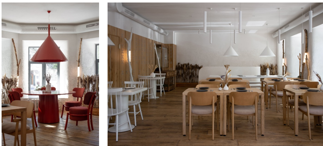
Рис. 2. Ресторан «Сто Років Тому Вперед» (автори – студія Valbek Bureau), м. Київ, Україна [2].

Інтер'єр ресторану «Salo Bar» у місті Києві, вдало поєднав у собі елементи декоративно-ужиткового мистецтва, «хату-мазанку» та сучасний лофт з гармонійними колірними рішеннями, адаптованими під сучасного споживача.